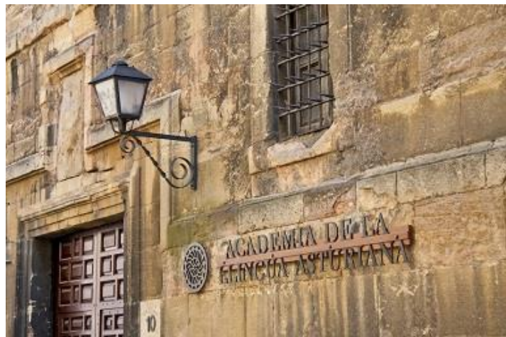
Figura 1: Fotografía de la Academia de la Llingua Asturiana.

La Academia de la Llingua Asturiana, de acuerdo con lo establecido en el artículo 4 de los principios generales de su marco estatuario tendrá su sede oficial en la ciudad de Oviedo. Concretamente, la Institución, desde su creación en el año 1980 se ubicó en la calle Santa Cruz 6 – 2º de la ciudad, si bien su ubicación actual es la calle del Águila, junto al Monasterio San Pelayo.