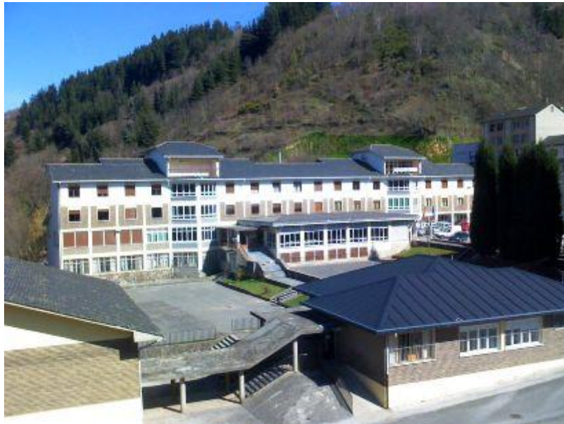
Figura 2: Fotografía de Universidad Asturiana de Branu (UABRA).

Tal y como señala en el portal de Educastur 6 “la Escuela Hogar dispone de 32 habitaciones para alumnos, normalmente ocupadas por una o dos personas. Sin embargo, durante las actividades del verano se colocan literas para que puedan ser usadas por más gente”.